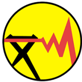
برق منطقه‌ای اصفهان