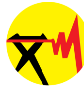
شرکت توزیع برق شهرستان اصفهان