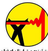
شرکت توزیع برق استان اصفهان