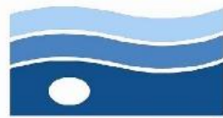
شرکت آب منطقه‌ای اصفهان